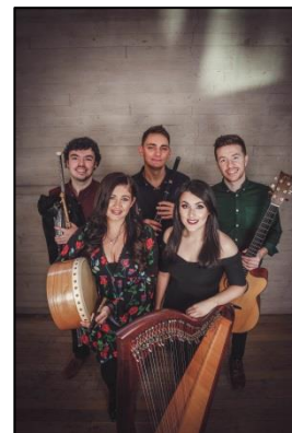
Connla (Irish Spring)